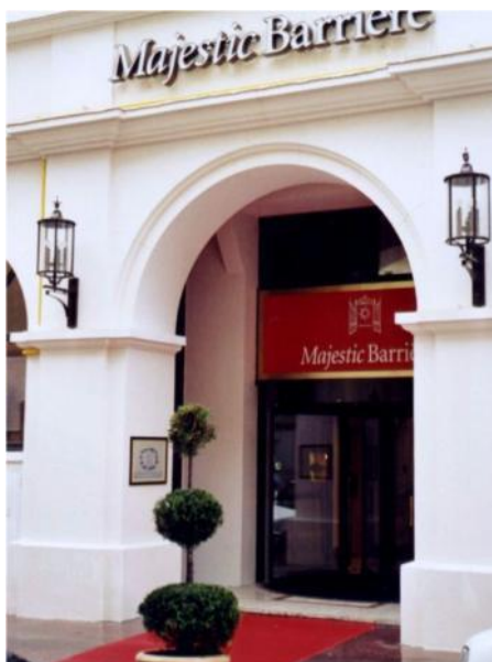
Façade de l'Hôtel Majestic Barrière à Cannes - Etudes & Réalisations Staff - Valbonne