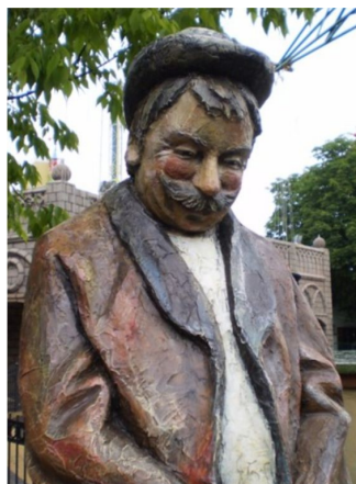
Personnage - 2 couches Acrystal Finition - Prater - Vienne - Roland Zojer (Fasching)

ATTENTION: L'Acrystal Prima supporte les intempéries, mais ne peut en aucun cas être immergé ou aspergé en permanence. En cas un contact prolongé avec de l'eau vous pouvez soit: