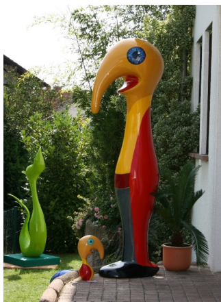
Haptikuss - 2 couches de peintures acryliques + 2 couches de vernis acrylique brillant - Silvia Baumer

ATTENTION: N'appliquer les produits de finition que sur des produits parfaitement secs (minimum 72 heures de séchage) afin d'éviter les problèmes de cloques.