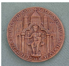
Sceau - Marc Toillié

Pour le moulage de pièces à sections très fines (quelques millimètres), il est possible de passer le ratio de mélange de l'Acrystal Prima de 1 pour 2,5 à: