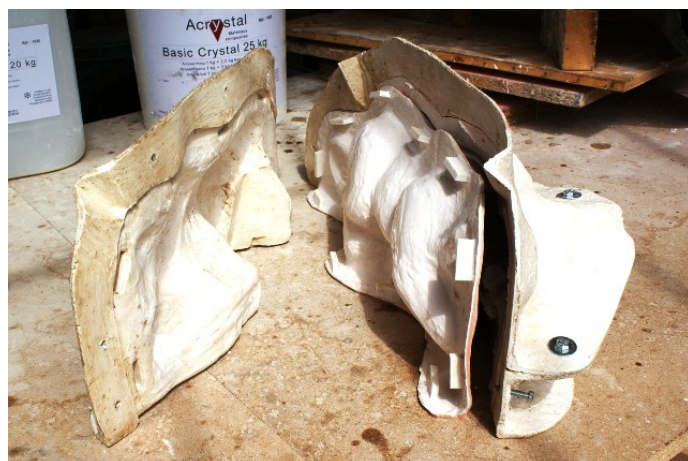
Chape de moule fine - Frédéric Vincent

L'Acrystal Prima est le produit idéal pour la réalisation de chapes de moules légères. L'absence de retrait évite les déformations de la chape au séchage. Même pour des chapes de grandes dimensions les renforts métalliques sont inutiles.