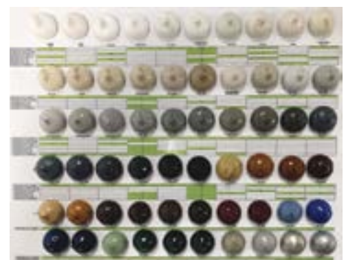
Acrom® - Déclinaisons de couleur disponibles

Le dossier technique permet au final de déboucher sur une étude économique de votre projet, incluant les coûts d'investissements, de produits et de process. L'institut Samaro étant certifié organisme de formation, nous vous proposons de former vos opérateurs aux bonnes pratiques industrielles et technique.