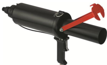
PISTOLET PNEUMATIQUE CARTOUCHE 380 ml

Le Serenys Magicfix a été développé pour tous types d'industries, ayant pour avantage une très grande résistance mécanique, tack très élevé, une adhérence multi-matériaux sans primaires même en milieu humide (acier, galva, aluminium, inox, plastiques, bois, béton, verre...), une viscosité élevée (pas d'affaissement, thixotrope). Enfin le produit respecte totalement la santé et la sécurité des opérateurs (aucun pictogramme de dangers).