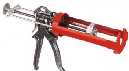
PISTOLET MANUEL CARTOUCHE 380 ml